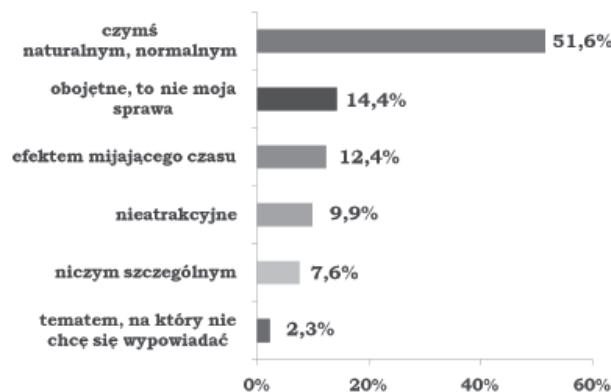
Wykres 3. Ciało człowieka starego jest dla mnie... Figure 3. The body of an old man is for me ...

Poproszono studentów o dokończenie rozpoczętych zdań, zgodnie z ich indywidualnymi przekonaniem. Jedno z nich brzmiało „Ciało człowieka starego jest dla mnie...” Wykres 3 ilustruje jakich odpowiedzi udzielali badani.