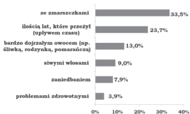
Wykres 4. Ciało człowieka staroego w pierwszej kolejności kojarzy mi się z....

na ilość lat, którą dana osoba przeżyła – na takie skojarzenia związane z ciałem seniora wskazywali badani. I podobnie jak przy poprzednim pytaniu, tak i w tym, w mniejszości byli ci, którym cielesność człowieka staroego kojarzy się z zaniedbaniem. Ciało zaniedbane to ciało nieatrakcyjne, czyli osoby, które o tym mówiły, patrzyły na cielesność seniora przez pryzmat jego wyglądu i atrakcyjności.